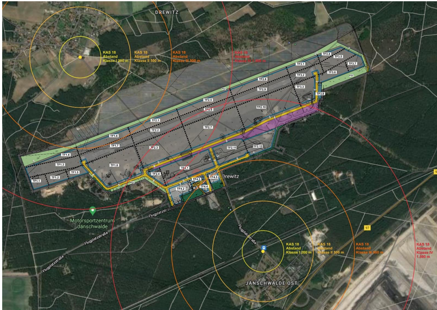
Abbildung 1 Ermittlung der Abstandsklassen