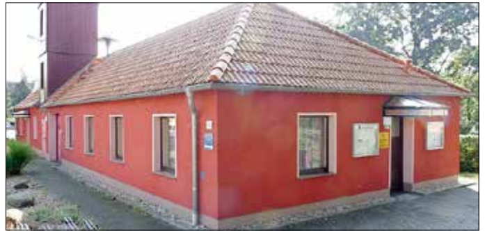
Das Gemeindezentrum und das Feuerwehrgerätehaus in Bärenbrück.