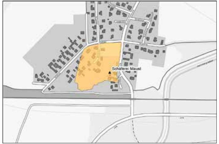
Abbildung 2: Einstige Lage der Schäferei Maust nach alten Flurkarten, © Dr.-Ing. Frank Knorr

Die damit gewonnenen Flächen, vor allem die Wiesenflächen, benötigte HUBERT für die Durchsetzung seiner Absicht, neue Teiche bei Lacoma und Maust anzulegen. Zu der Zeit wurde eine erste Hütungs-Separation durchgeführt, d.h. bisher gemeinschaftlich mit den Kossäten und Büdner zur Viehhütung genutzte Flächen wurden unter dem Vorwerkspächter HUBERT und den Mauster Kossäten und Büdner aufgeteilt (separiert). Da in Lacoma HUBERT alle ihm zugefallenen Hütungsflächen für das Anlegen neuer Teiche genutzt hatte, war der dortigen Schafhaltung die Futtergrundlage entzogen. Deshalb wurden bald nach 1778 in Maust ein Schafstall und ein Schäfereihaus errichtet. Allerdings waren die Futtergrundlagen für die Schafhaltung auch danach noch immer unzureichend, weshalb die Weide zeitweise sogar bis nach Bärenbrück gelegt werden musste.