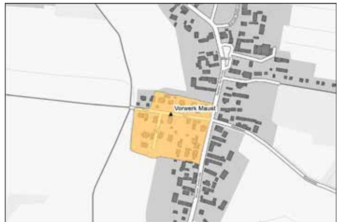
Abbildung 1: Einstige Lage des Vorwerkes Maust nach alten Flurkarten

Heute sind fast keine materiellen Überreste des Gutes mehr vorhanden. Nur den älteren Maustern ist noch bekannt, wo sich die Gebäude, Stallungen und Scheunen sowie weitere Baulichkeiten befanden und wie sich Gut und dörfliche Gemeinschaft wechselseitig beeinflussten. Dabei hatte die Existenz des Vorwerkes/ Gutes über Jahrhunderte erheblichen Einfluss auf die Entwicklungsmöglichkeiten der Kossäten- und Büdnerwirtschaften einerseits und die Erwerbsmöglichkeiten der Dorfbewohner andererseits