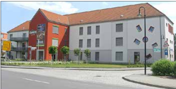
Die Oase99 in Peitz.