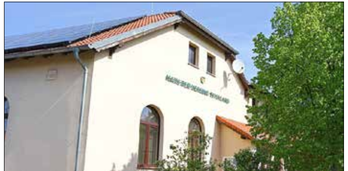
Das Haus der Vereine in Neuendorf.