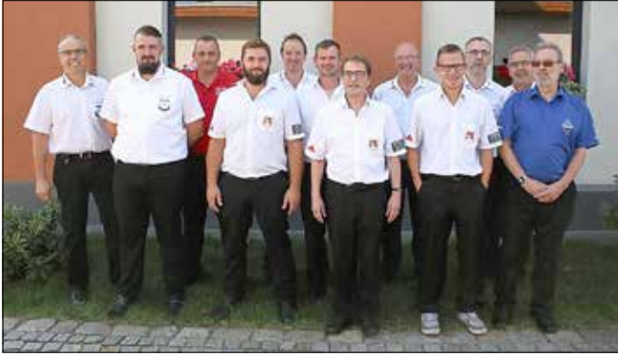
Netzen und Jänschwalde I

Am 12.09. hatte man dann den 2. der Bundesliga, die SG Rot-Weiß Netzen zu Gast.