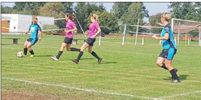
Die Hochoza Miezen in Pink - 4 Spiele, 4 Siege!

Seit Anfang August rollt im Vereinsfußball das runde Leder wieder über den Rasen. Somit ging es auch für die Damen der „Hochoza Miezen“ wieder los. Sie hatten den kleinen Vorteil, dass der Abschluss der alten Saison gleich den Anfang der neuen bildete. Wochen vor Ligastart hatten sie ihr Pokalfinale mit starkem und furiosem Spiel.