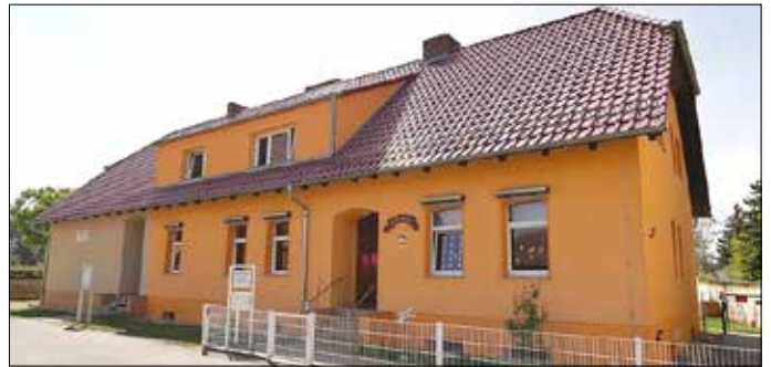
Die Kita „Kunterbunt“ in Preilack.