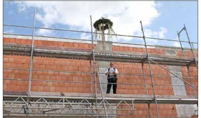
Der Zimmermann bei seinem Richtspruch.