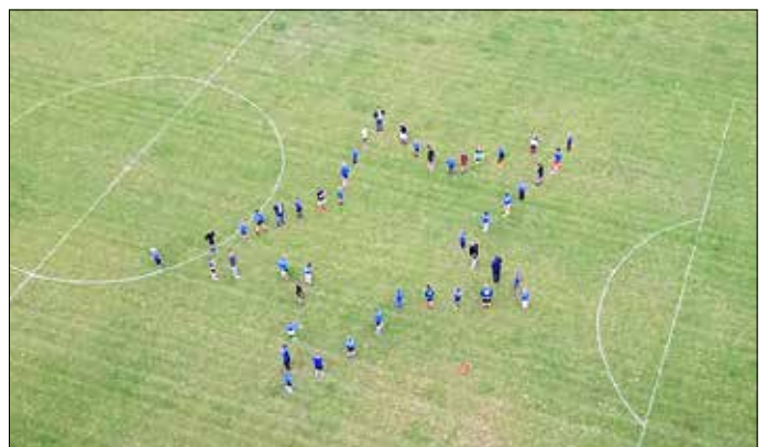
Einträchtige Menschenkette mit Abstand in Sternform.

Der Stern ist mit einem Preisgeld von 1.500,- Euro dotiert. Die Eintracht freut sich riesig über den Gewinn. Mit dem Bronzestern im Gepäck geht es nun auf die Silberstufe. Dort treten alle besten Regionsprojekte von Brandenburg an. Wer weiß, vielleicht ist die Eintracht auch hier erfolgreich.