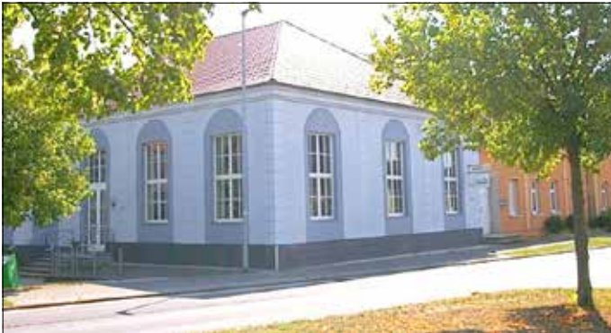
Das Gemeindezentrum in Grieben.