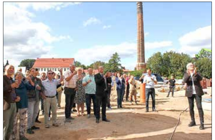
Zahlreiche Zuschauer verfolgten den Richtspruch.

Ganz traditionell wurde das Dach mit dem Richtkranz geschmückt sowie als Dank, an alle am Bau Beteiligten, ein Spruch vom Zimmermann aufgesagt und gleichzeitig um Gottes Segen gebeten. Wie es üblich ist, prostete der Redner auf das Wohl der Bauherren sowie der künftigen Mieter und warf am Ende des Richtspruchs das Glas vom Dach. Die Scherben signalisieren gutes Gelingen und eine solide Zukunft.