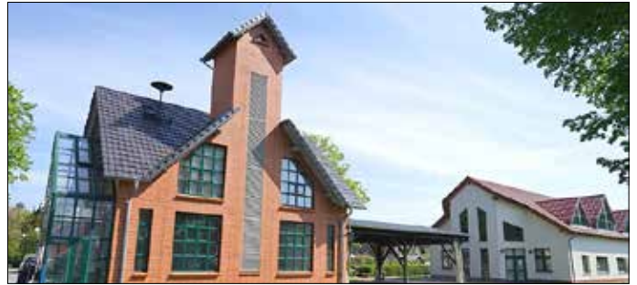
Das Feuerwehrgerätehaus und das Gemeindezentrum in Maust.