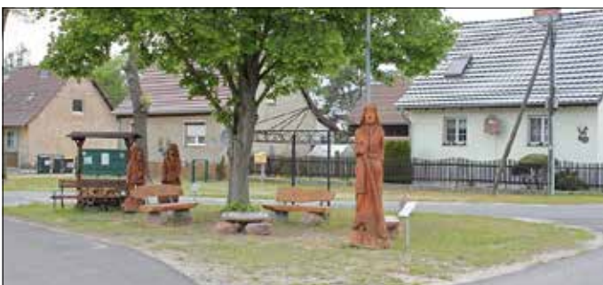
Ein gemütlicher Platz zum Verweilen in Schönhöhe.