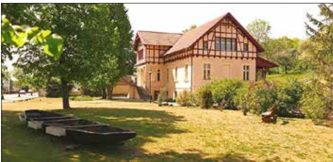
Das Gemeindehaus in Tauer.