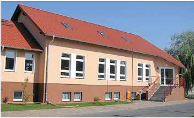
Das Dienstleistungszentrum in Drewitz.