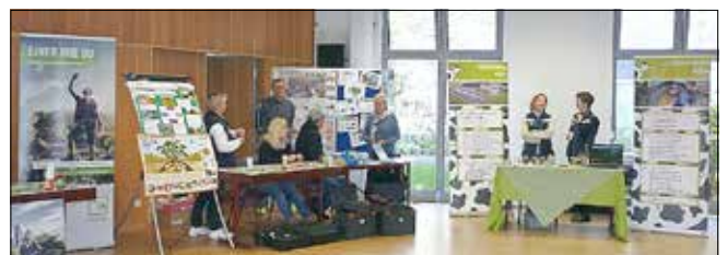
Ausbildungsmesse 2019 in Peitz

Bereits zum zehnten Mal führt das Amt Peitz in Kooperation mit der Oberschule „Peitzer Land“, dem Wirtschaftsrat Peitz e. V. und der Agentur für Arbeit Cottbus eine Ausbildungsmesse in Peitz durch.