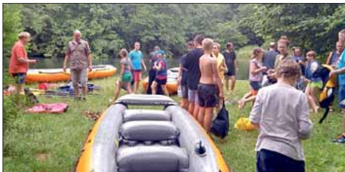
Schlauchboottour auf der Spree

Die Veranstaltung begann am Vormittag in Neuendorf am Haus der Vereine. Nachdem sich alle versammelt hatten, fuhren wir nach Neuhausen zum Wehr an der Spree. Dort erwartete uns ein Mitarbeiter von PARIJA (Lausitz-Kanu). Er hatte auf seinem Bootsanhänger 6 Schlauchboote aufgeladen. Nachdem die Kinder auf die Boote verteilt wurden ging es los zur Wildwasserfahrt. Jetzt war Teamgeist gefragt. Das Boot sollte so gut es ging stromabwärts bewegt werden. Die erste Pause war an der Kutzeburger Mühle, wo ein Imbiss gereicht wurde. Danach ging es weiter bis zum Kiekebuscher Wehr, wo die Boote um das Wehr getragen wurden.