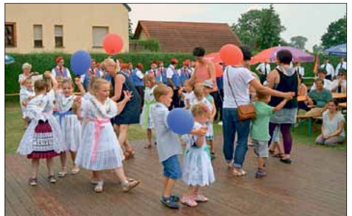
Die Kitakinder gratulierten mit der Annemarie-Polka.

Der kurzzeitig durch das Unwetter ausgefallene Strom störte nicht, denn die Musiker hatten ja alle ihre Instrumente dabei.