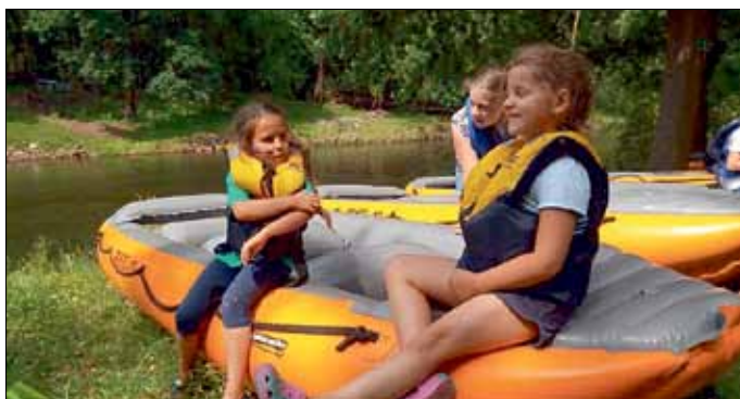
In der Pause die Sonne genießen

Nach dem erneuten Einsetzen in die Spree ging es nach 4,5 Stunden Fahrzeit zum verkürzten Ziel, zum Branitzer Wehr. (Eigentlich wollten wir bis zur Spreewehrmühle fahren, aber das Drachenbootrennen in Cottbus verhinderte das Vorhaben.)