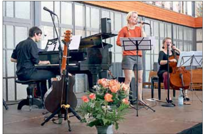
Das Trio Port 116 verzauberte das Publikum

Am 8. Juni gab das „Trio Port 116“ in der Evangelischen Kirche in Peitz für die Seniorinnen und Senioren sowie alle Freunde der Musik ein fantastisches Konzert.