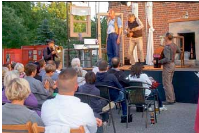
Sommertheater in Peitz

Inhaltlich angelehnt an das jeweilige Themenjahr von Kulturland Brandenburg wird in den Sommermonaten vor historischer Kulisse in zahlreichen Altstädten Theater gespielt. Unter dem Motto „Handwerk“ beschäftigt sich das Theater diesmal mit der eigenen Zunft und erlaubt spielerisch einen Blick in die Werkstatt. Für die diesjährige Sommertournee hat das theater 89 zwei Einakter des berühmten irischen Dramatikers Sean O'Casey ausgewählt: „Das Ende vom Anfang“ und „Gutenachtgeschichte“. Damit gastierten sie am 9. Juli in Peitz. Die Künstler waren bereits das vierte Mal bei uns zu Gast.