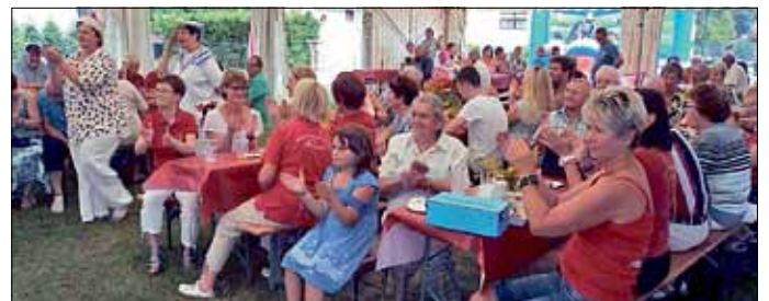
Gute Stimmung beim Fest 2015

Uns erwartet wieder im Festzelt an der Feuerwehr/Gemeindezentrum Maust ein reichhaltiges Unterhaltungs- und Kulturprogramm, dass um 15 Uhr mit unserer traditionellen Kaffee- und Kuchentafel, bei zünftiger Blasmusik mit den Peitzer Stadtmusikanten, beginnt. Es gibt u.a. eine tolle Tombola, vielfältige Angebote nicht nur für Kinder, der Schützenkönig wird ermittelt und um unsere Lachsmuskeln kümmert sich „Blümchen“. Durch den Nachmittag begleitet uns die Disco „Zonk“, die auch am Abend Zu später Stunde erwarten uns „The Peep toes“ mit ihrer Burlesque Show. Für eine gute gastronomische Betreuung ist den ganzen Tag gesorgt.