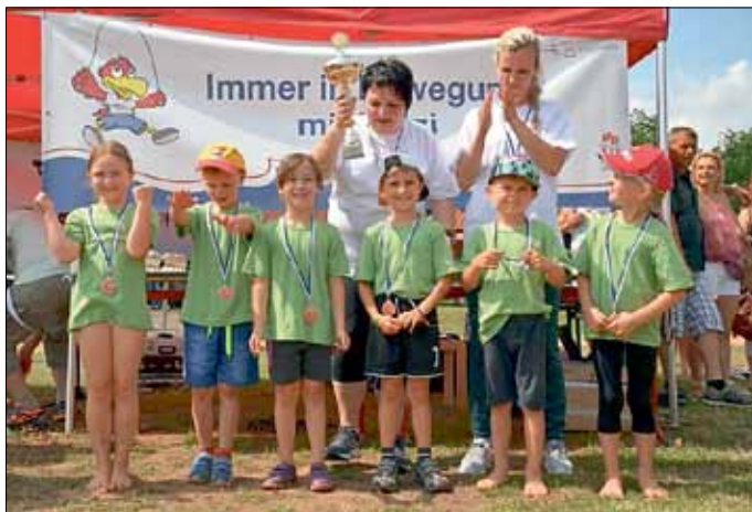
Die Siegermannschaft der Kita Heinersbrück

Ein herzliches Dankeschön für das gelungene Sportfest an die Kita Sonnenschein Peitz, an die sportlichen Kinder, die Erzieher/innen und Eltern sowie alle fleißigen Helfer.