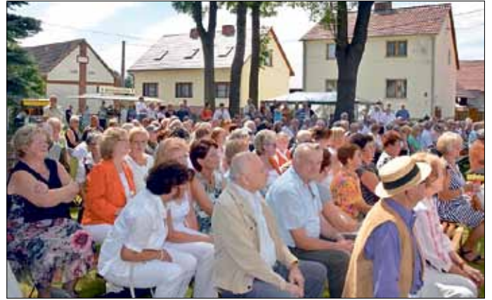
Bei sonnigem Wetter und guter Versorgung freuten sich die Besucher über den Gesang.