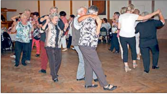
In Drachhausen wurde viel getanzt und gern die beliebte Anne-marie-Polka

Das Programm wurde von den Lindenmusikanten mit zünftiger Musik ansprechend gestaltet und sorgte für fröhliche Stimmung und gute Unterhaltung. Bei Tanz, gutem Essen und Getränken, wieder bestens versorgt von der Verdi GmbH Turnow, war es für alle ein schöner geselliger Nachmittag. Ein Dank an alle, die zum guten Gelingen der Peitzer Seniorenwochen beigetragen haben. Diese gemeinsamen Veranstaltungen geben Schwung und Elan und beflügeln die Seniorenarbeit in den einzelnen Orten des Amtes Peitz.