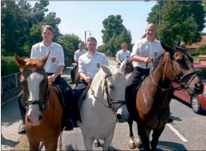
Hahnrupfen in Tauer 2015

Bereits zum 37. Mal feiern die Jugend und die Gemeinde Tauer ihr traditionelles Hahnrupfen, wozu alle recht herzlich eingeladen sind.