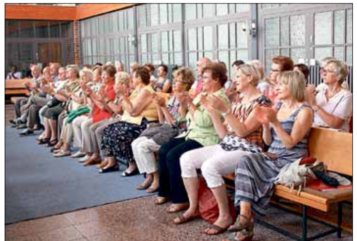
Begeisterte Konzertbesucher

Die drei jungen Leute hatten eine bunte musikalische Mischung mitgebracht, die in der wunderbaren Akustik dieser Kirche ein besonderer Ohrenschaus war.