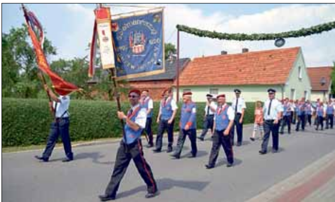
Festumzug durch Turnow, frohgelaunt bei gefühlten sommerlichen 40 Grad.

Übrigens, erstmals wurde zum feierlichen Anlass die neue Gemeindefahne mit Gemeindewappen gehisst.