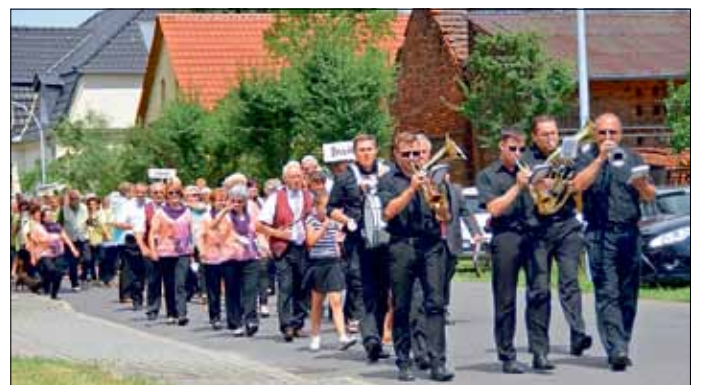
Die Ströbitzer Blasmusikanten führten den Festumzug an.

Viele Sangesfreunde und Besucher fanden sich am 9. Juli in Drewitz am Festplatz an der Kirche ein, um mit dem Gemischten Chor Drewitz das Chorjubiläum mit frohem Gesang zu feiern.