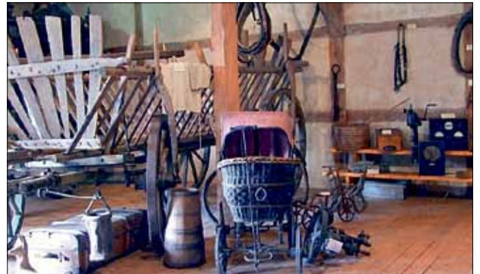
Ausstellung in der einstigen Pfarrscheune