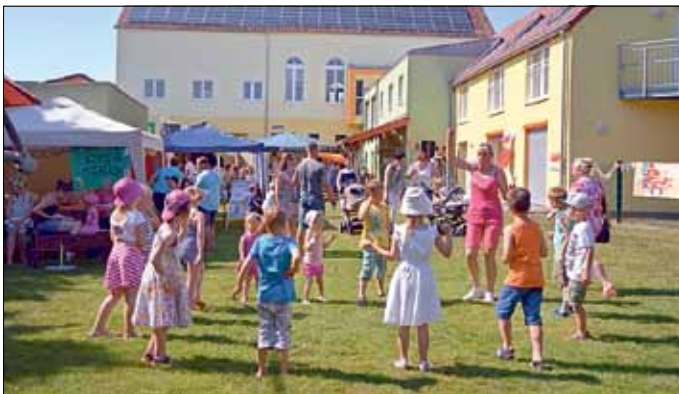
Spiel, Spaß und Tanz mit der „Spieletante“

1968 erfolgte der Umzug der Kita an den heutigen Standort in der Dorfstraße, während die Krippe im Gebäude des heutigen Gemeindezentrums eingerichtet wurde. Seit 1994 haben Krippe, Kita und Hort zusammen im Kitagebäude ihr zuhause gefunden. Das Gebäude selbst wurde 2012 durch die Gemeinde mit Hilfe von Fördermitteln für ca. 1,2 Mio Euro umfassend umgebaut, saniert und erweitert. Heute werden in der „Kita Benjamin Blümchen“ in Turnow 63 Kinder von 7 Erziehern betreut. In dem modernen, zukunftsfähigen Gebäude haben sich die Bedingungen für Kinder und Erzieher wesentlich verbessert. Auch der Spiel- und Außenbereich wurde erneuert und besonders für die ganz Kleinen neu gestaltet. Zum Jubiläum gab es von der Gemeinde noch ein Sonnensegel als Schattenspender.