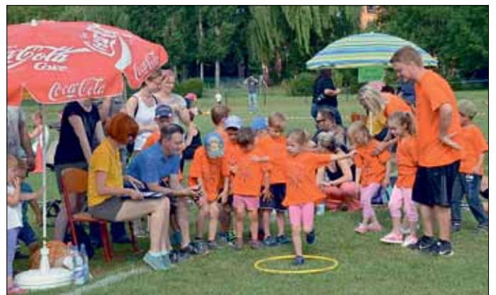
Stehen auf einem Bein nach Zeit