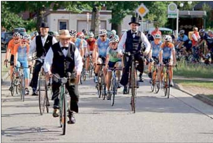
Radtourenfahrt mit Start und Ziel in Maust

Das Motto der Teichlandradler „Erlebnis steht vor dem Ergebnis“ kam an diesem Tag voll zum Tragen.