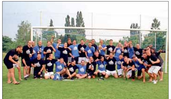
Jubel und Freude bei der Mannschaft und den Fans

Am Ende ein souveräner Aufstieg in dem die Peitzer klarmachten, wer der berechnete dritte Aufsteiger ist.