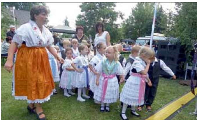
Die Kinder 2015 auf dem Weg zum Hahnrupfen

Besonderer Höhepunkt in diesem Jahr wird ein Hahnrupfen für „Jung und Alt“.