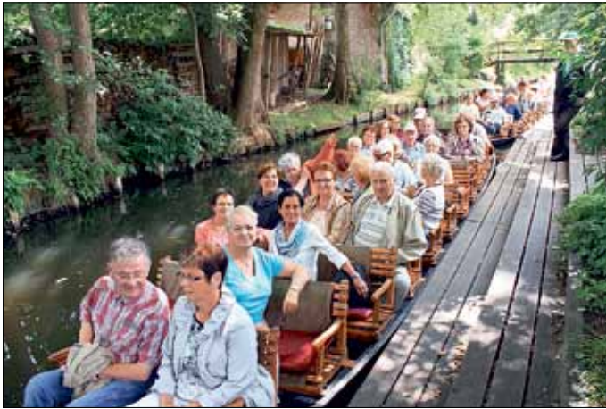
Auf zwei großen Kähnen fanden alle Platz

Bereits zum zehnten Mal trafen sich am 28. Juni die Senioren aus der polnischen Partnergemeinde Zbaszynek und dem Amt Peitz, um während der Brandenburgischen Seniorenwochen gemeinsam interessante Stunden zu erleben und diese schöne Partnerschaft weiter zu pflegen.