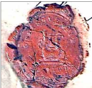
Siegel des Vereins mit der Lyra