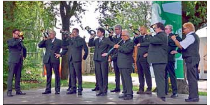
Die Peitzer Jagdhornbläser erreichten den 4. Platz mit dem Prädikat „Sehr gut“ und konnten sich in den Leistungen verbessern.