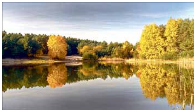
Badeteich Drachhausen

Die inzwischen angesammelte Vielfalt an Motiven drängte geradezu nach einer Ausstellung, die nun unter dem Titel „Lebensraum und Artenvielfalt im Peitzer Land“ im Kreishaus des Landkreises Spree-Neiße“ zu sehen sein wird.