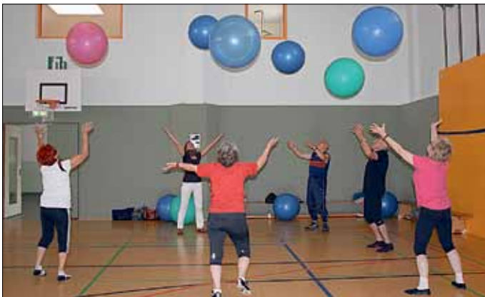
Bei der Ballgymnastik in Aktion

Der Seniorenbeirat des Amtes Peitz hatte alle sportbegeisterten Seniorinnen und Senioren wieder zur inzwischen sehr beliebten Gymnastik-Werkstatt eingeladen, welche am 26.05.2016 im Rahmen der diesjährigen Seniorenwochen wieder in der Turnhalle der Mosaik-Grundschule stattfand.