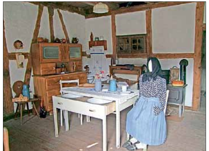
Im Seitengebäude wird bäuerliches Leben vorgestellt.

Im Laufe der letzten 20 Jahre wuchs die Ausstellungsfläche des Heimatmuseums stetig an. Die baufällige historische Fachwerkscheune des Pfarrgehöftes wurde mit Fördermitteln restauriert. Ein besonderes Exponat in diesem Bereich ist ohne Zweifel der alte Leichenwagen, der schon immer hier untergebracht war. In der Scheune wird aber auch die Keramikausstellung „Im Feuer geboren“ des Sammlers Siegfried Kohlschmidt gezeigt, die als umfangreichste Sammlung ihrer Art in der Lausitz gilt. Die Ausstellungsbereiche im einstigen Schulhaus wurden erweitert und die gesamte Ausstellungsarchitektur neu gestaltet. Letztlich wurde nach einer Restaurierung auch das Stallgebäude des Pfarrhofes in das Museum einbezogen. Das Museum verfügt heute über eine Ausstellungsfläche von über 600 Quadratmetern und zählt damit zu den großen Museen im Landkreis Spree-Neiße.