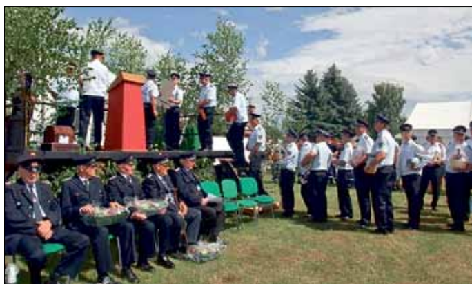
Zahlreiche Gratulationen zum Jubiläum

Während der Feierlichkeiten zeigte auch die Rettungshundestafel ihr Können. Vermisste Personen wurden innerhalb kürzester Zeit von den Hunden gefunden.