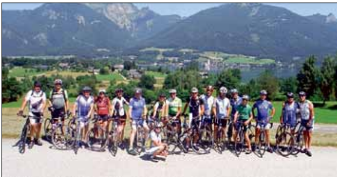
Die Teichlandradler im Salzburger Land

Zur Einstimmung erfahren wir bei einer Stadtführung Interessantes zur Geschichte der Mondsee-Region, wie Besiedelung, Pfahlbauten oder dem Handel mit Salz.