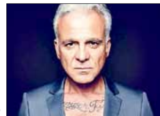
Nino de Angelo