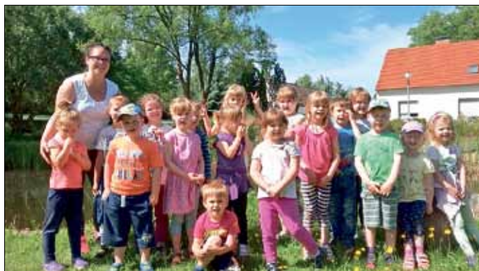
Die Kinder hatten viel Spaß bei den Entdeckungen.

Auch Pferde zu streicheln und reiten zu dürfen stand ganz oben auf der Wunschliste der Kinder.