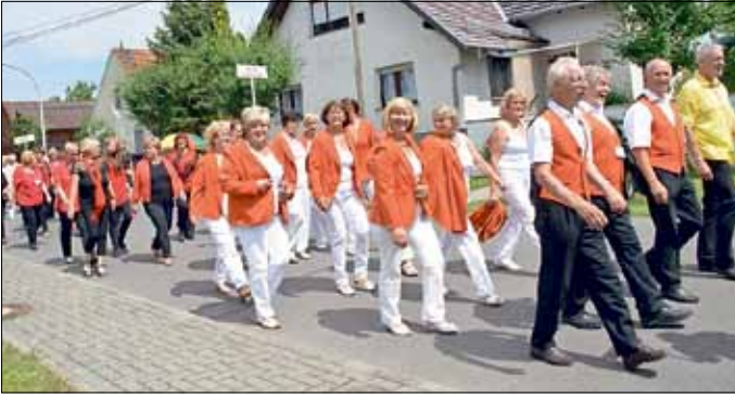
Frohgelante Sangesfreunde: der Gemischte Chor Teichland