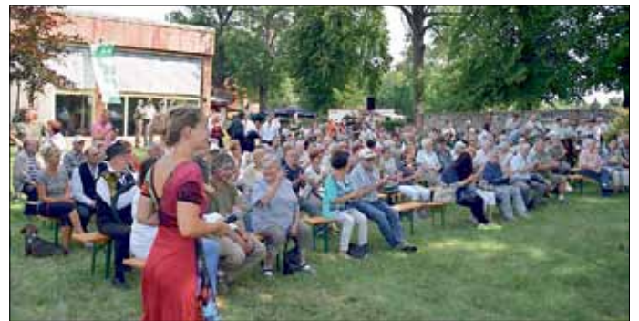
Die Besucher freuten sich über die einzelnen Beiträge der Bläsergruppen.